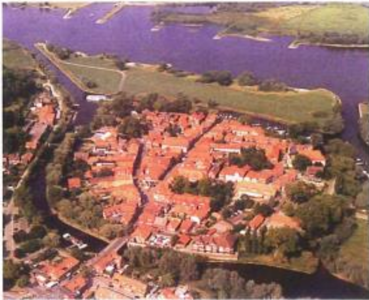
Hitzacker im Juni 2004