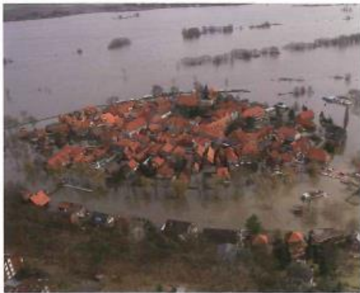
Hitzacker im April 2006