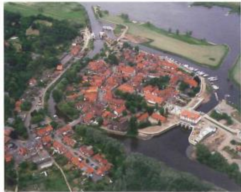
Hitzacker im Juni 2008